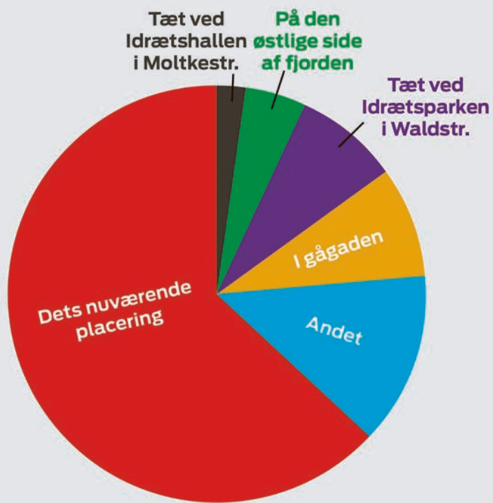
(Kilde: Dansk Centralbibliotek i Sydslesvig, Grafik: Eyla Boysen)

Hvis du skulle vælge beliggenheden af Flensborg Bibliotek, hvor skulle det så være?